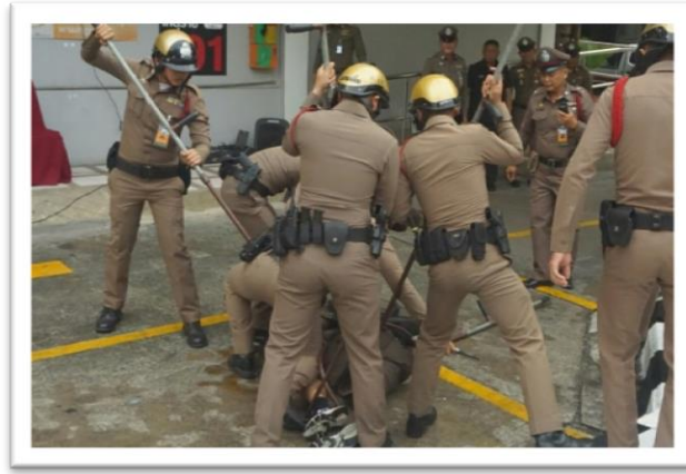
ตัวอย่างการใช้ไม้ง่ามในการควบคุมคนร้าย

2.2.3 ปฏิบัติการตามยุทธวิธี กรณีจำเป็นเร่งด่วน ให้เข้าระงับเหตุตามลำดับการใช้กำลัง โดยพิจารณาความเหมาะสมตามสัดส่วน ตามสถานการณ์และพฤติกรรมของคนร้าย และสภาพแวดล้อม